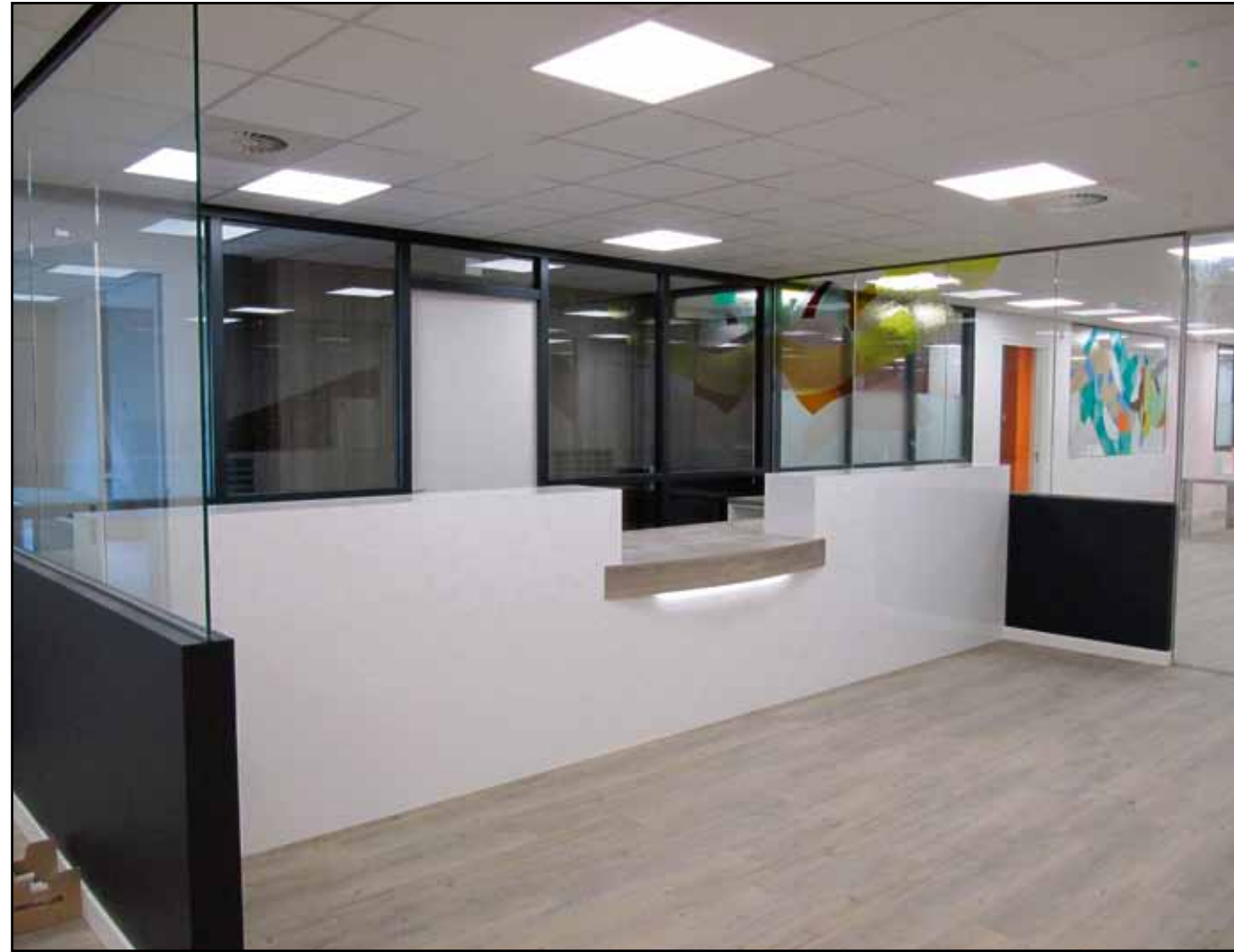
De balie voor de patiënten van de huisartsen