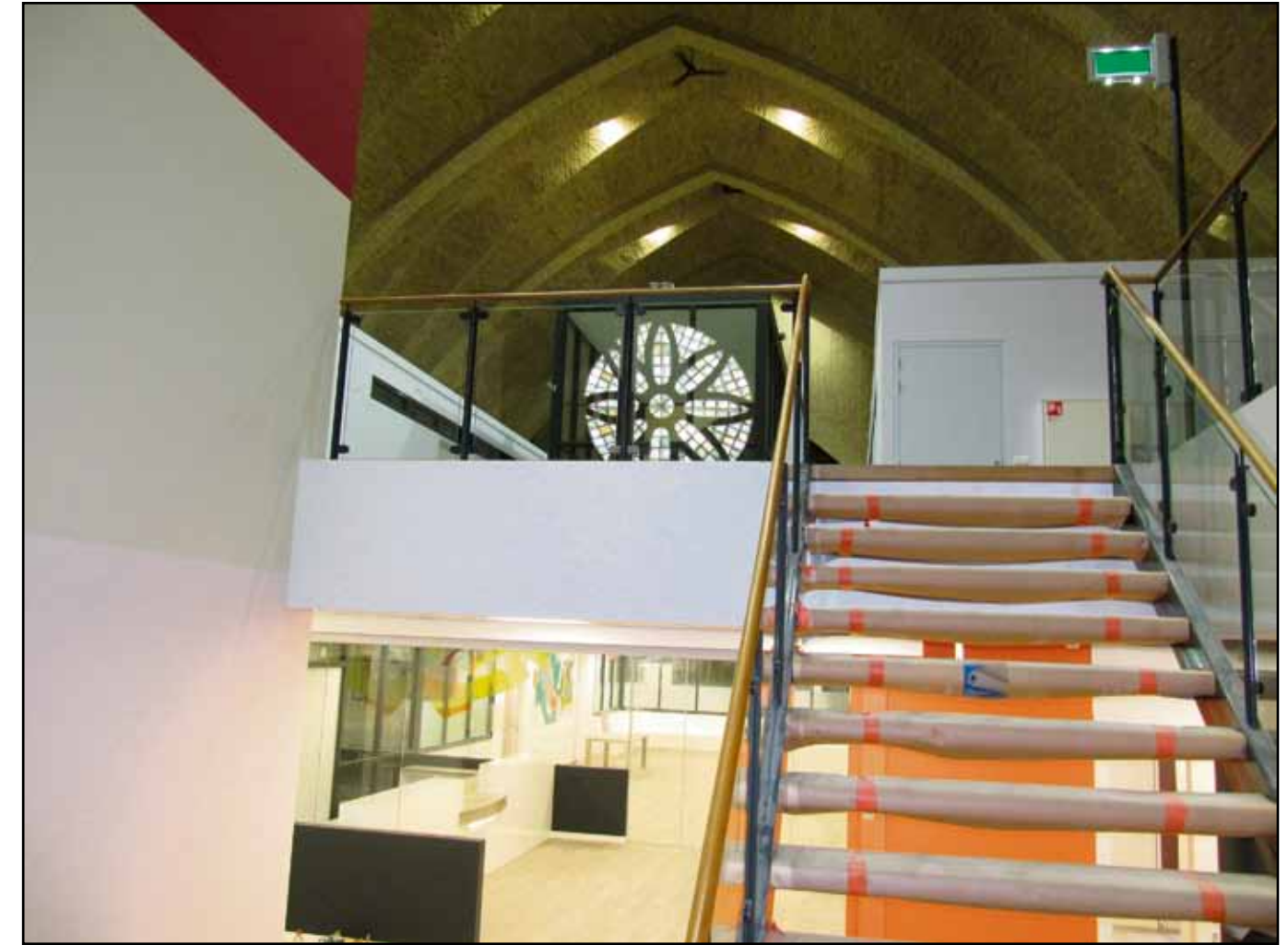
De nog ingepakte treden van de trap naar de tweede verdieping