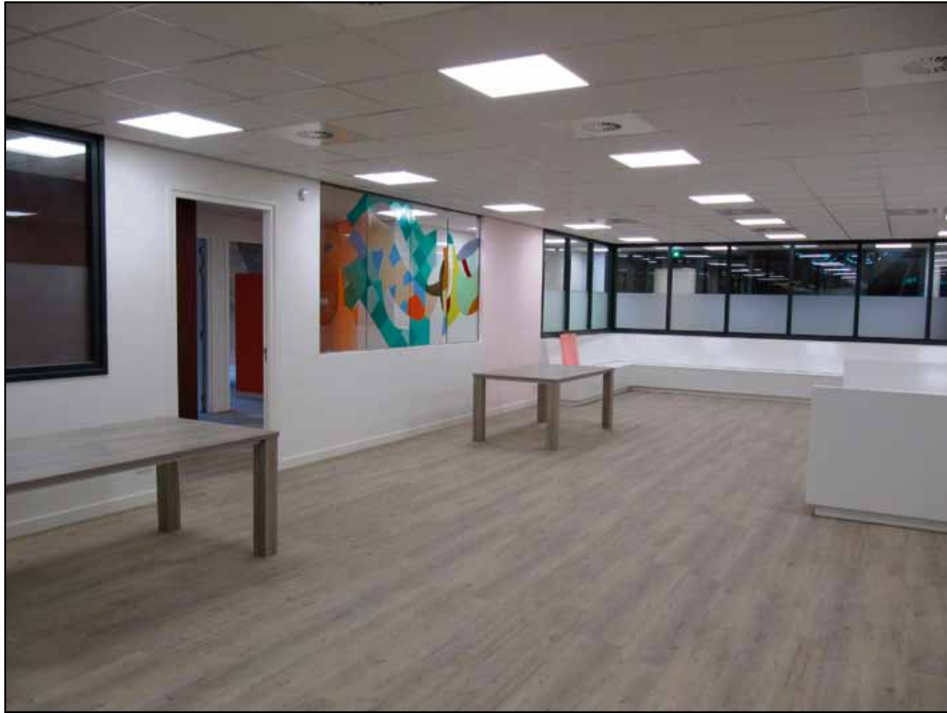
De wachtkamer voor de patiënten van de huisartsen